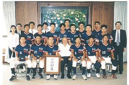
知事表敬訪問時に、知事直筆の色紙を手に記念撮影