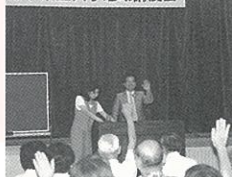
熊本県立大学地域講演会